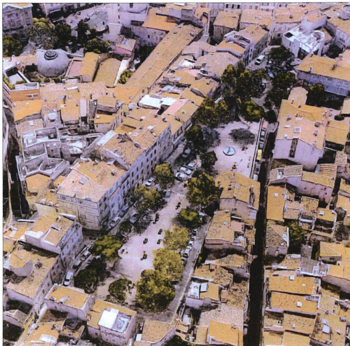
Vue d'ensemble de la place depuis le Nord